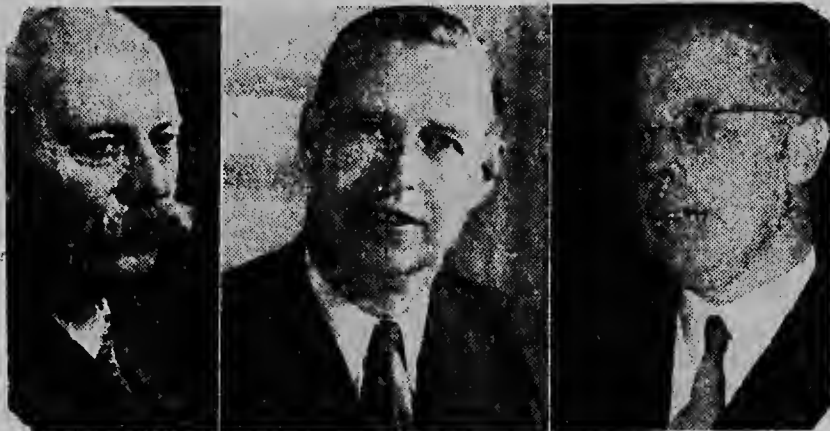
Op deze foto ziet men (v.l.n.r.) Prof. P.S. Gerbrandy, Jhr. Mr. A.W.L. Tjarda van Starckenborgh en Prof. Dr. L.J.M. Beel, die op verzoek van H.M. Koningin Juliana en Z.K.H. Prins Bernhard een onderzoek zullen instellen naar de omstandigheden die hebben geleid tot de wijze waarop men in de buitenlandse pers artikelen heeft gepubliceerd rond het Nederlandse hof.

Trouw schrijft over de mededeling van H.M. de koningin en Z.K.H. prins Bernhard over de instelling van een driemanschap, dat deze van grote betekenis is.